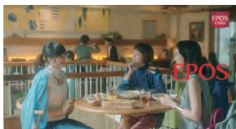
マルイ EPOSCARD WEEKS TVCM「+EPOS」篇