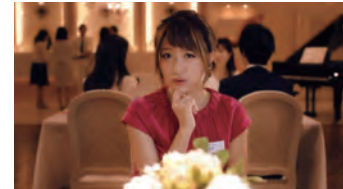
アソビモ アヴァベルオンライン TVCM 「結婚相談所」/「プレイ」篇