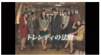
KIRIN iMUSE WEB CM 「トレンディの法則」篇