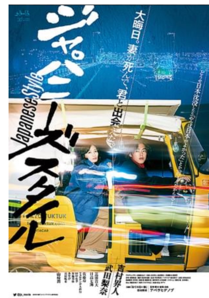
2022年 映画『ジャパニーズスタイル』監督・脚本