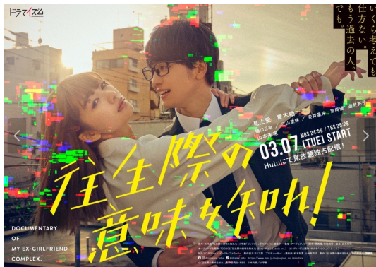
2023年 MBS「往生際の意味を知れ!」全話監督