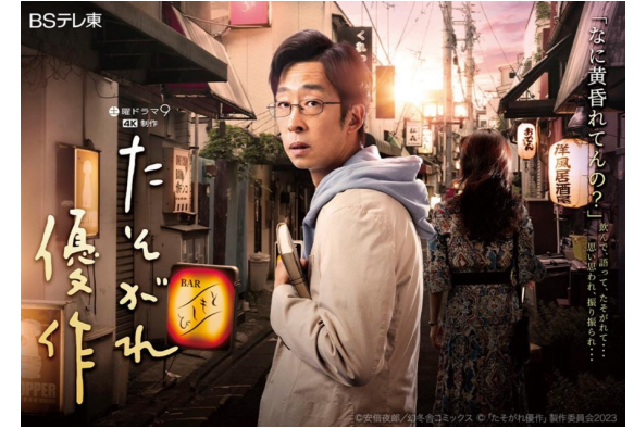
2023年 BSテレ東「たそがれ優作」監督