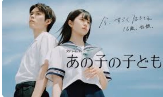
2024年 カンテレ「あの子の子ども」監督