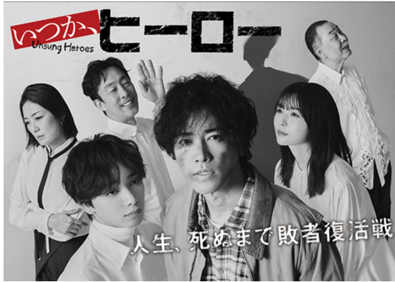
2025年 ABC「いつか、ヒーロー」監督

1989年3月1日生まれ、ニューヨーク生まれ大阪育ち。大阪芸術大学芸術学部映像学科卒業。監督・脚本家・俳優。 卒業制作の映画「死にたすぎるハダカ」が日本ポストプロダクション協会主催「JPPA AWARDS2012」の奨励賞を受賞、カナダ開催のファンタジア国際映画祭で入賞。 「めちゃくちゃなステップで」はSSFF&ASIA2014 UULAアワードでグランプリ他、受賞歴多数。 俳優としても映画『ヤクザと家族』NHK連続テレビ小説「おかえりモネ」、「恋せぬふたり」などに出演。