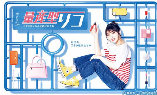
2022年 TX「量産型リコ」全話監督