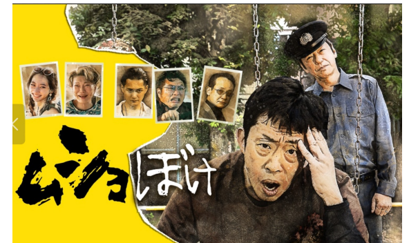
2021年 ABC「ムショぼけ」監督